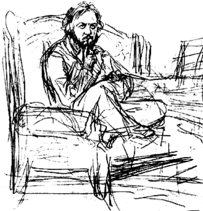
Glinka in een studie van Repin