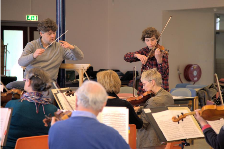
Het orkest repeteert in 'de Amandelbloesem' in Wormerveer